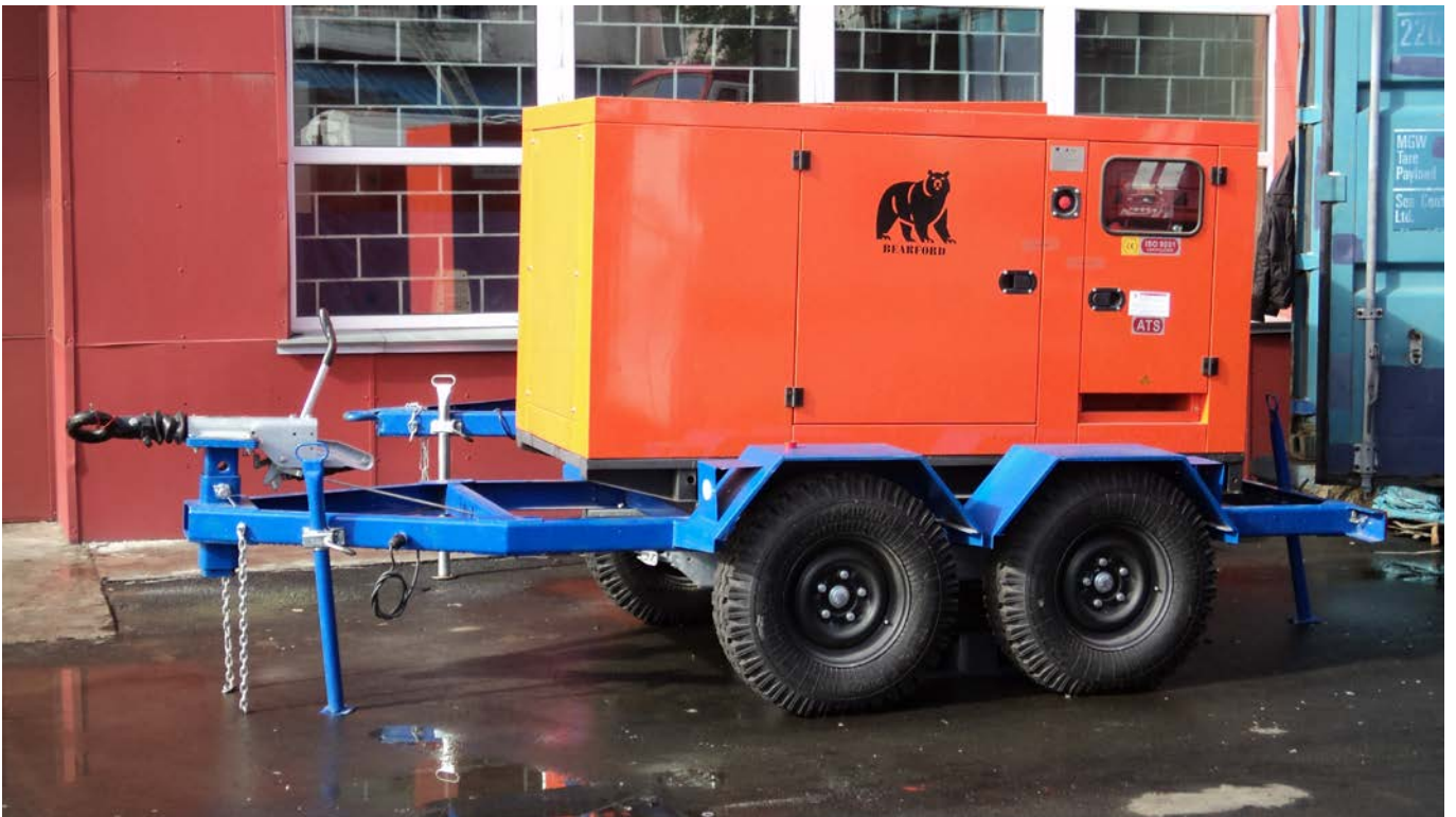
аварийный источник питания