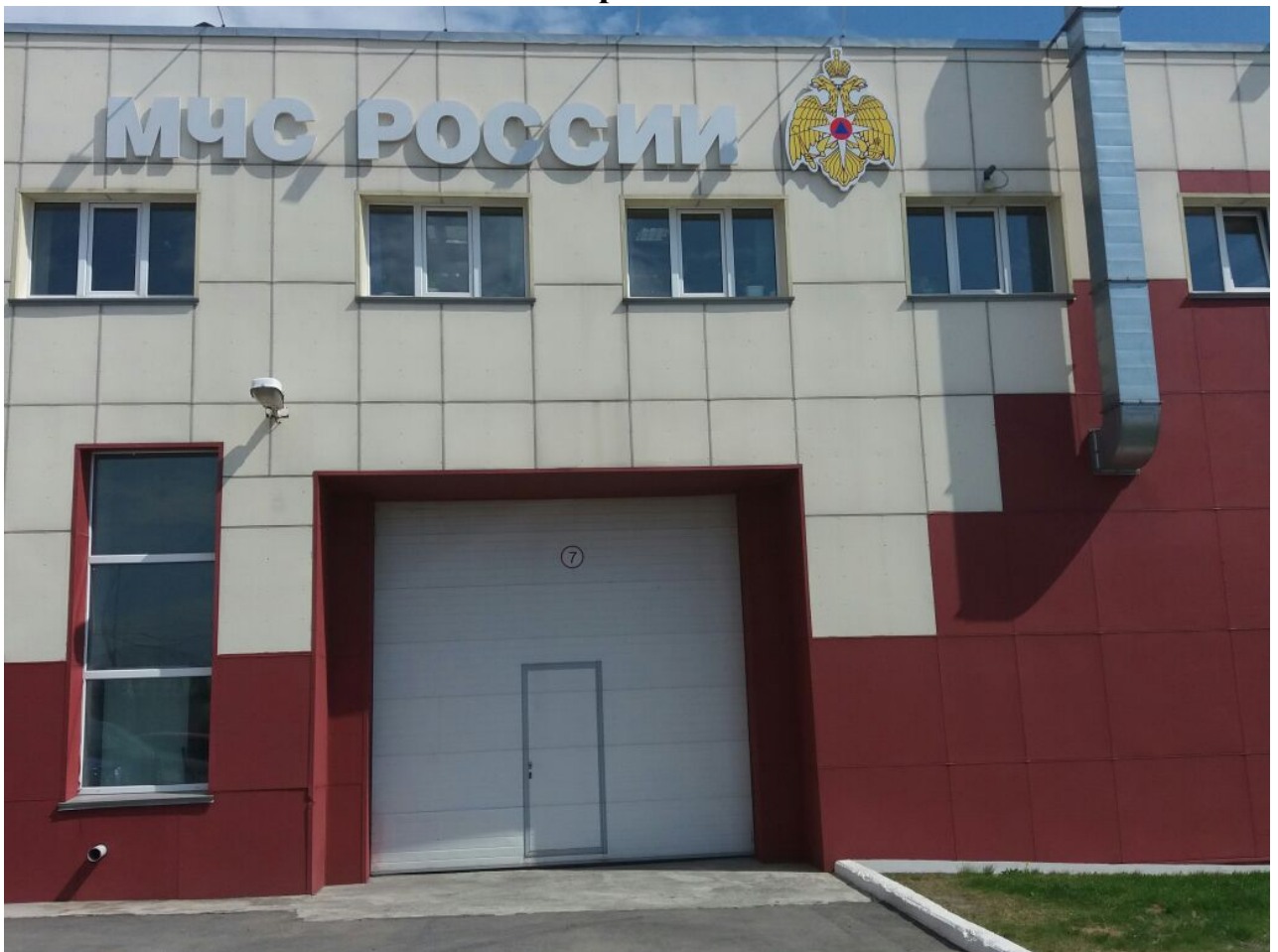
пост мойки автомобилей