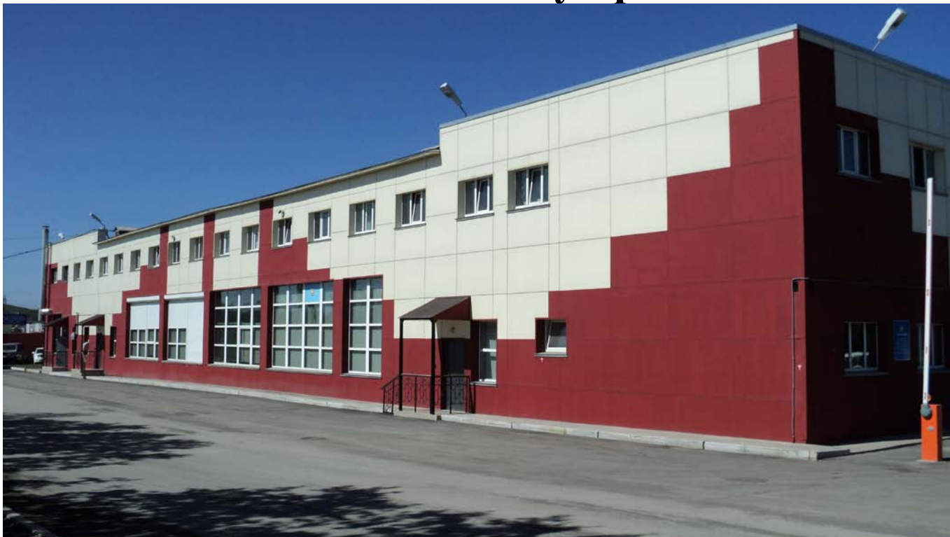
фасад здания ФАУ «ЦМТО ФПС по Камчатскому краю»