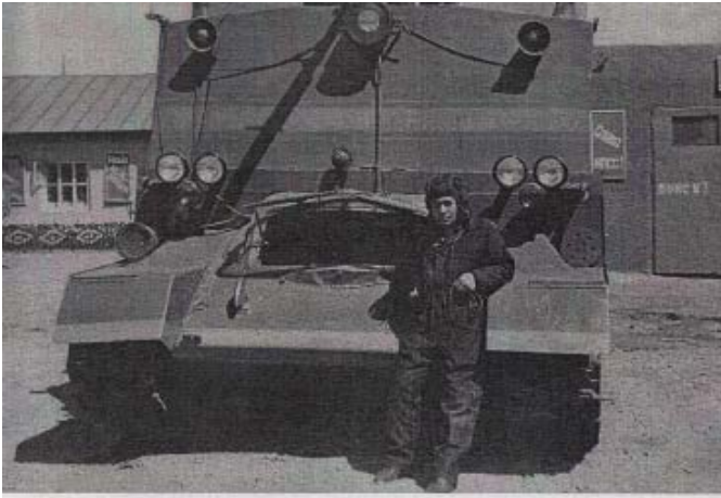
1980 год. Установка пенного тушения на базе Т-34, находящаяся в боевом расчете ПЧ ТС ОПО УВД Камчатского облисполкома и предназначенная для тушения пожаров и проведения аварийно – спасательных работ.