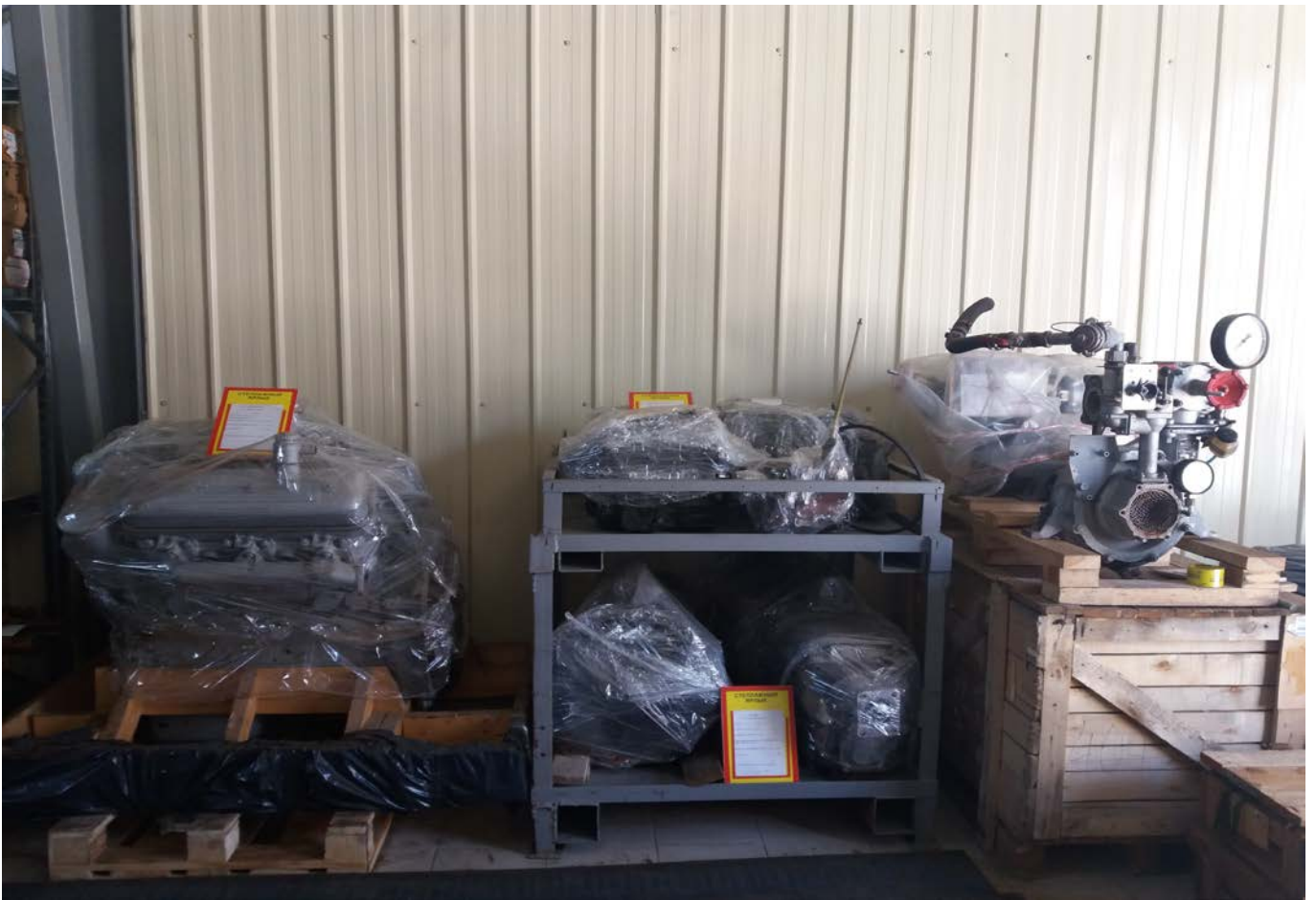
хранение агрегатов 2 категории